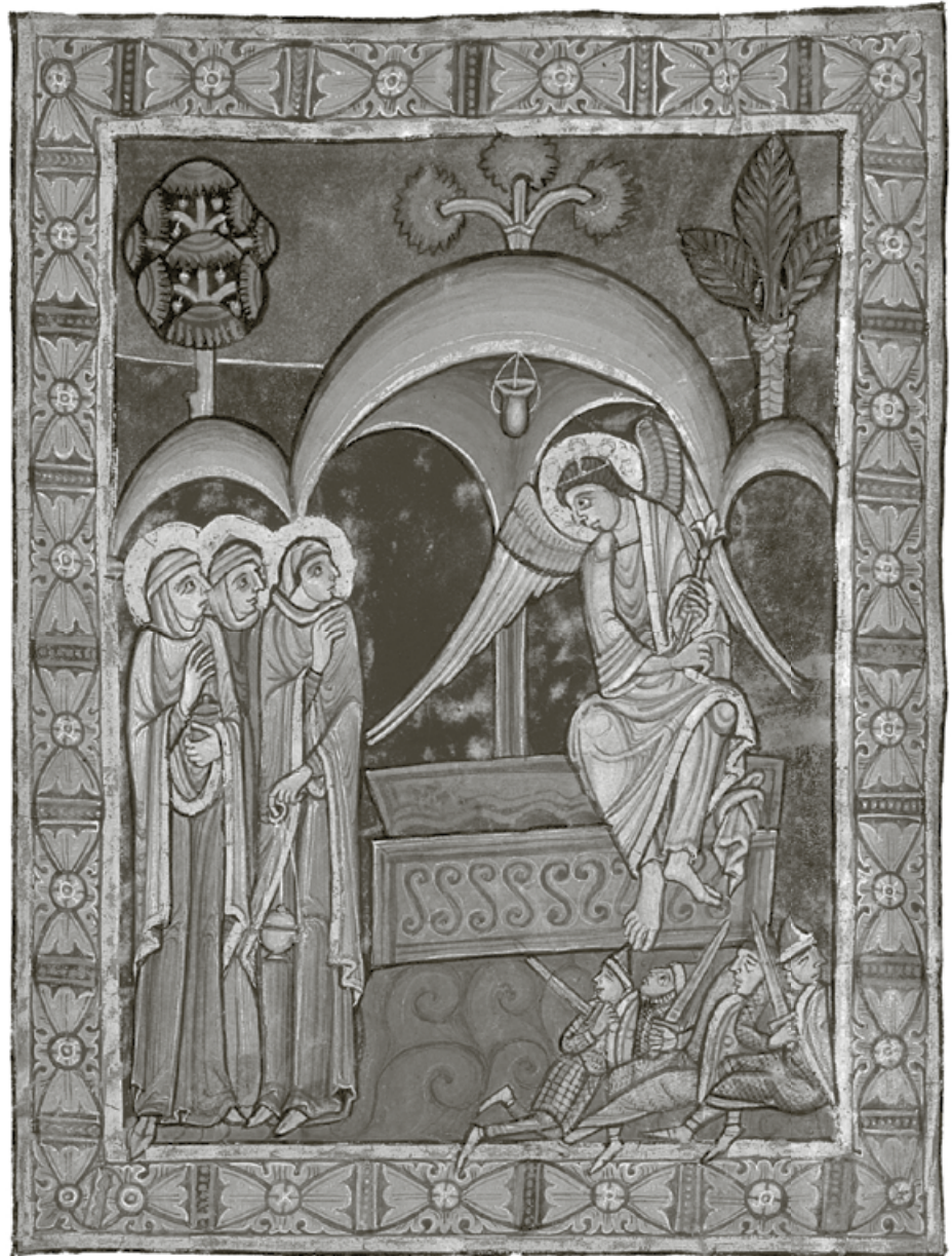
Albani-Psalter (ca. 1130): Ostermorgen, die drei Frauen am Grab